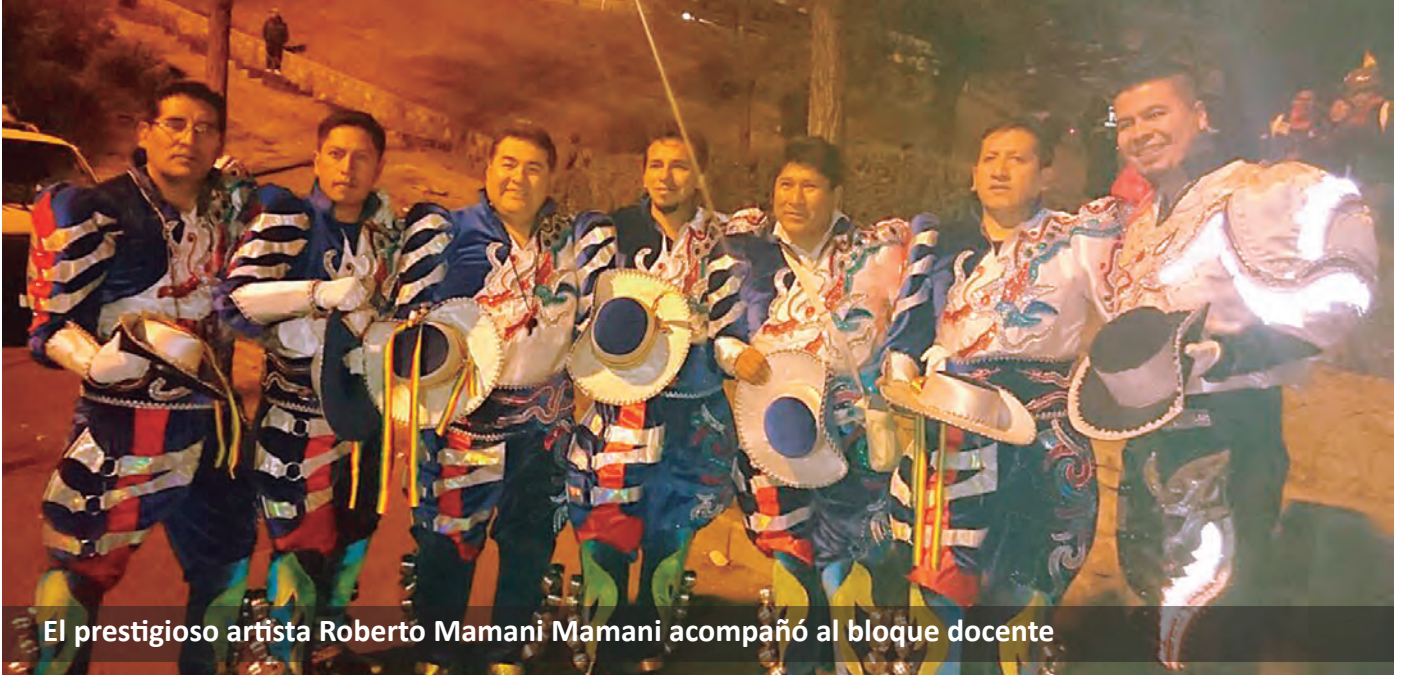
El prestigioso artista Roberto Mamani Mamani acompañó al bloque docente