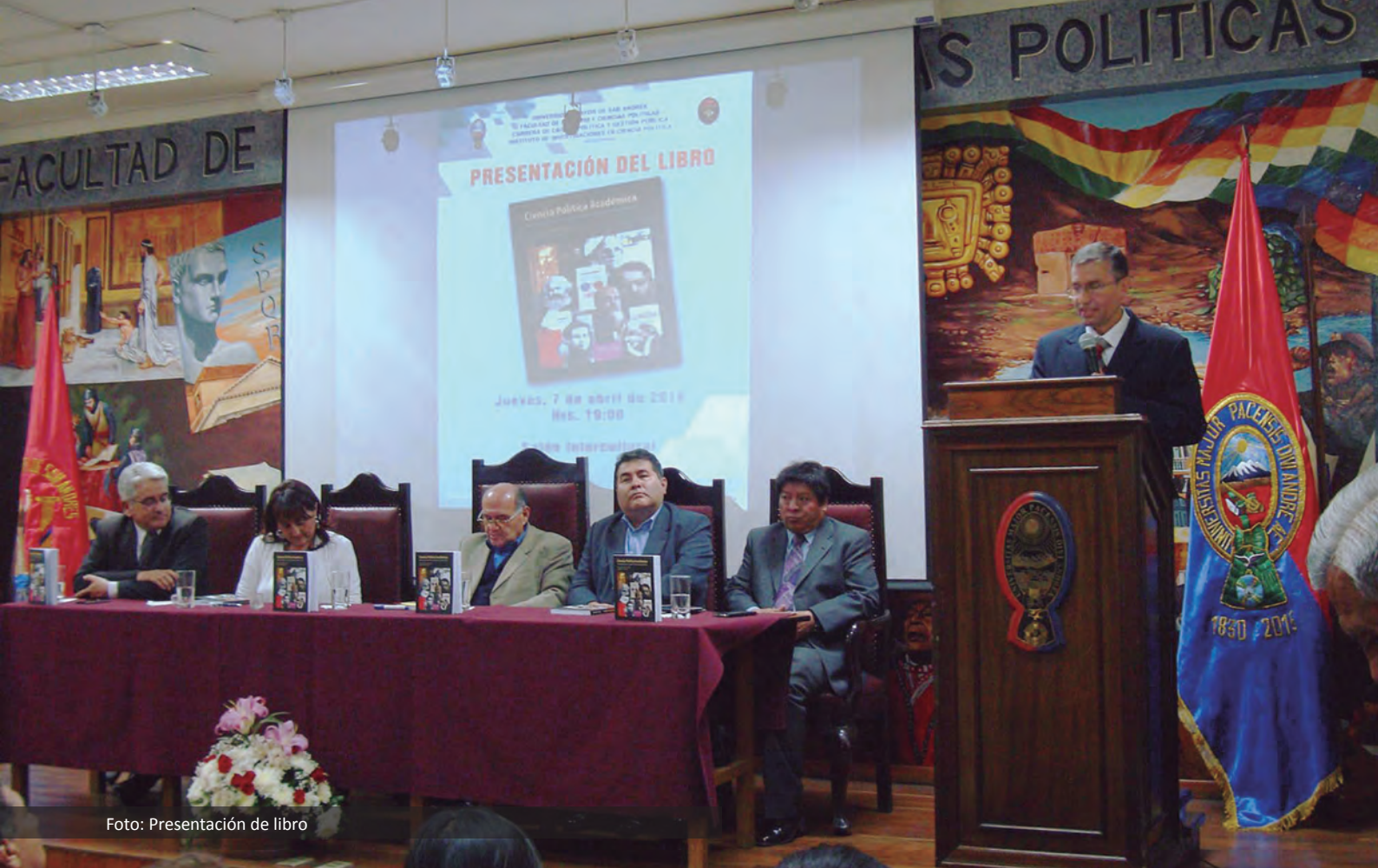
Foto: Presentación de libro