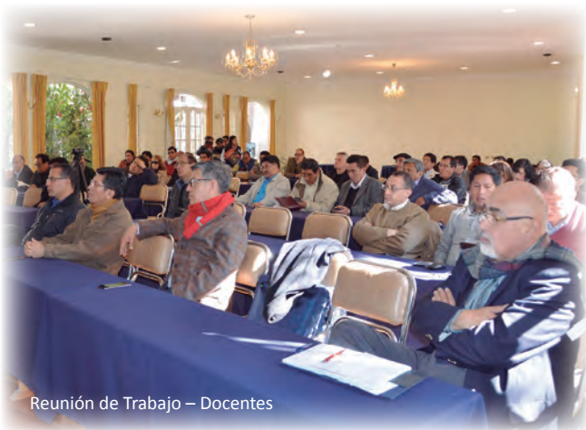
Reunión de Trabajo – Docentes

de 70 estudiantes, 15 docentes y 5 administrativos, haciendo un total de 90 personas.