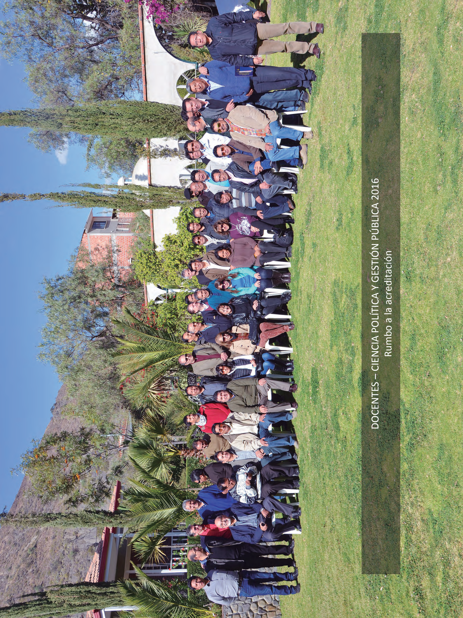
DOCENTES – CIENCIA POLÍTICA Y GESTIÓN PÚBLICA 2016 Rumbo a la acreditación