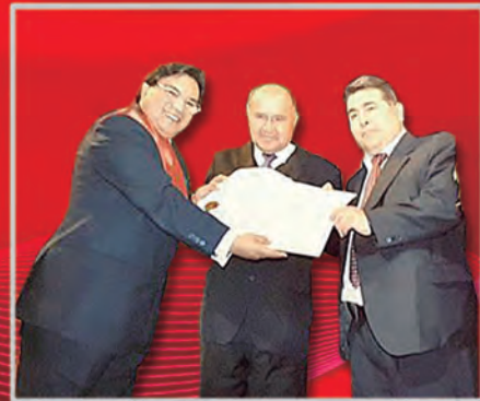
Escudo de Armas Nuestra Señora de La Paz, para la Carrera de Ciencia Política