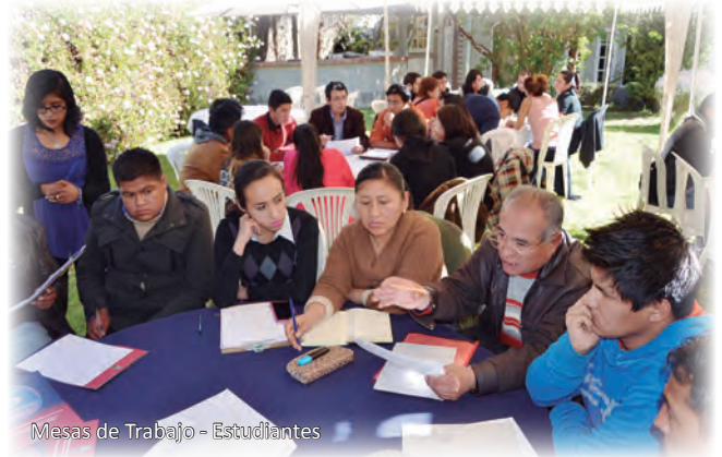
Mesas de Trabajo - Estudiantes

En la reunión se consideraron las variables e indicadores correspondientes a los estudiantes, y se determinaron cuáles serán las principales fuentes de información y los medios de verificación para la Autoevaluación. La jornada tuvo el aditamento de que se hicieron mesas de trabajo estudiantiles con el fin de tomar en cuenta las reflexiones de los estudiantes respecto del proceso de evaluación y acreditación, especialmente vinculadas al área 5.