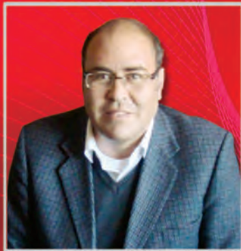
Adiós al amigo, docente e investigador de la UMSA