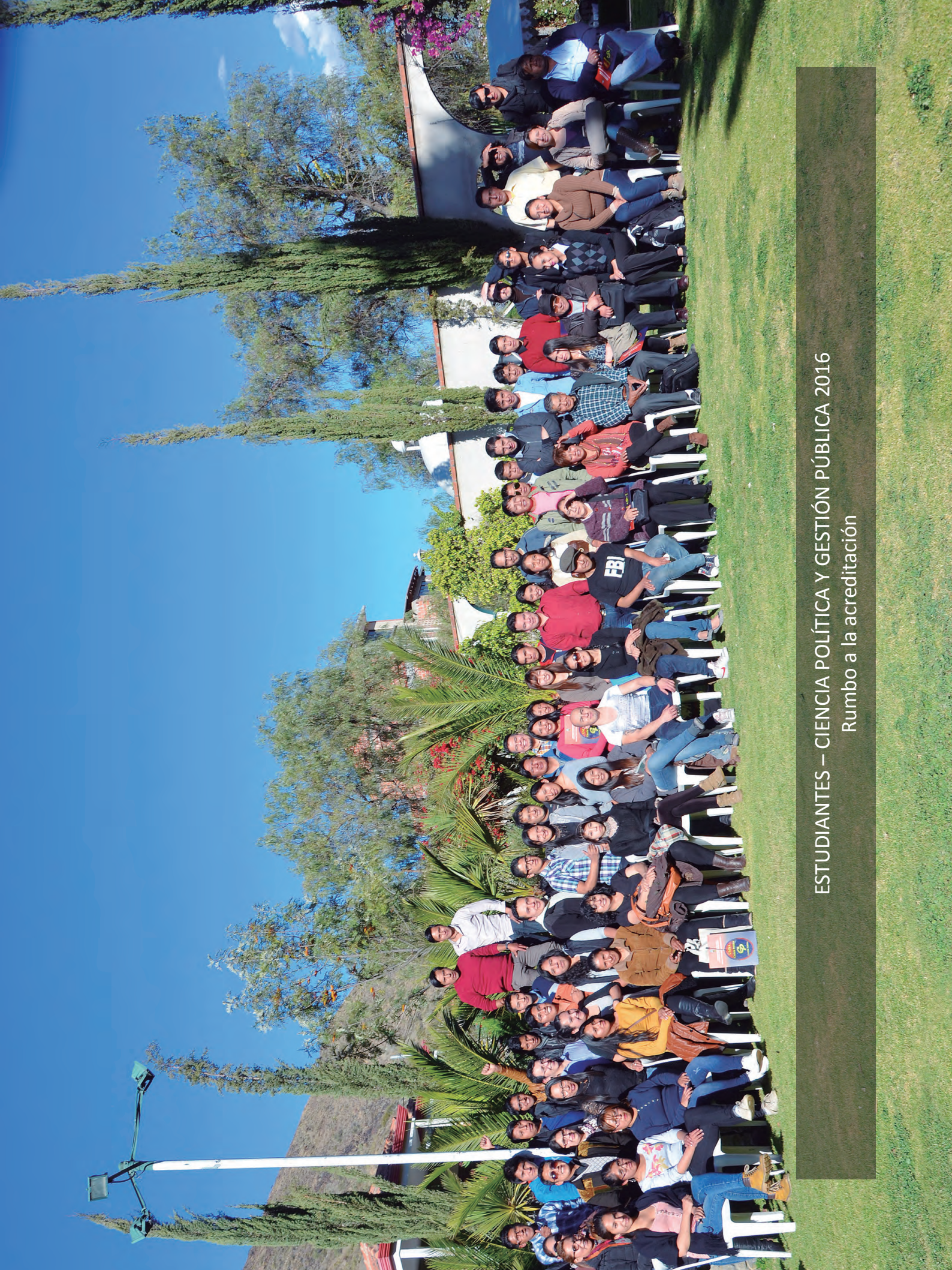
ESTUDIANTES – CIENCIA POLÍTICA Y GESTIÓN PÚBLICA 2016 Rumbo a la acreditación