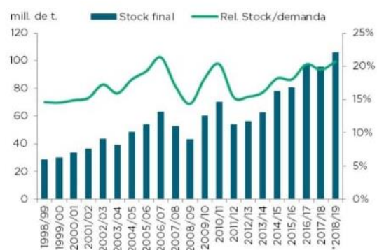
GRAFICA N° 4 NIVEL DE PRODUCCIÓN DE SOJA DE EE.UU.